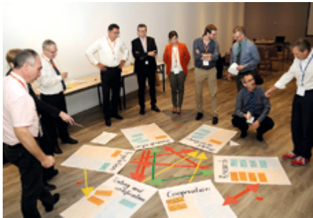
Workshop "Interazione degli strumenti"

Tra i temi conduttori della 5ª conferenza EUROSHNET tenutasi a Siviglia vi è stato, oltre al cambiamento del mondo del lavoro, l'invito a una più intensa cooperazione. Normazione, prova e certificazione, ricerca, sorveglianza del mercato e regolamentazione sono strumenti importanti per la prevenzione, ma solo se usati in sinergia possono risultare efficaci e tenere il passo con gli ultimi sviluppi nel mondo del lavoro.