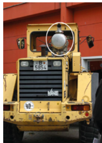
Filtro antiparticolato ostacola la vista